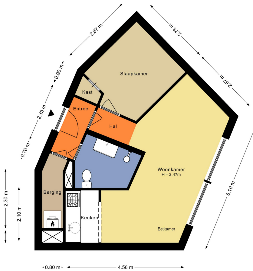
Spitsbergenstraat 79 Amsterdam Eerste verdieping

De plattegronden zijn geproduceerd voor promotionele doeleinden en ter indicatie. Aan de plattegronden kunnen geen rechten worden ontleend. © www.debeeldenmakers.nl